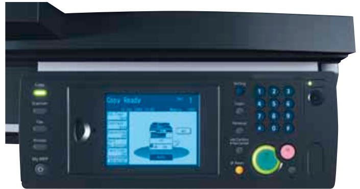
D 240f TOUCHSCREEN, EENVOUDIG IN HET GEBRUIK EN FUNCTIONEEL.

Bij de aanschaf van een compact zwart-witsysteem wordt vaak ingeleverd op kwaliteit. De D 240f vormt hierop een prettige uitzondering. Doordat er gebruik wordt gemaakt van een polymeertoner met zeer kleine en fijne deeltjes kunt u kantoordocumenten van hoge kwaliteit produceren, zelfs bij het printen van kleine lettertypen. Dankzij een scan-naar-printfunctie kunnen op deze multifunctional gescande documenten direct naar het dichtstbijzijnde kleurensysteem worden verzonden en in kleur worden geprint. Op deze manier profiteren alle medewerkers op de afdeling van de voordelen van een compact zwart-witsysteem, maar kunnen ze indien nodig altijd terugvallen op kleur.