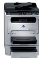
magicolor 1690MF-dt met duplexeenheid en optionele papierinvoer