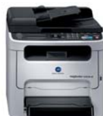
magicolor 1690MF standaard