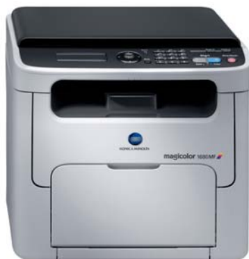
magicolor 1680MF standaard