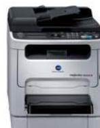
magicolor 1690MF-d met duplexeenheid